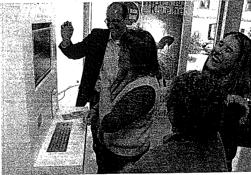
Am Computerterminal füllt sich der virtuelle Einkaufskorb in kurzer Zeit mit Waren und Wissenswerten. Die gespannten „Testkäufer“ erfahren anschließend, wie es um ihr Konsumverhalten und ihr Bewusstsein für Produkte aus der Region bestellt ist. Spaß scheint das obendrein zu machen.

Am Landratsamt wurde eine Wanderausstellung zum Thema Konsum eröffnet